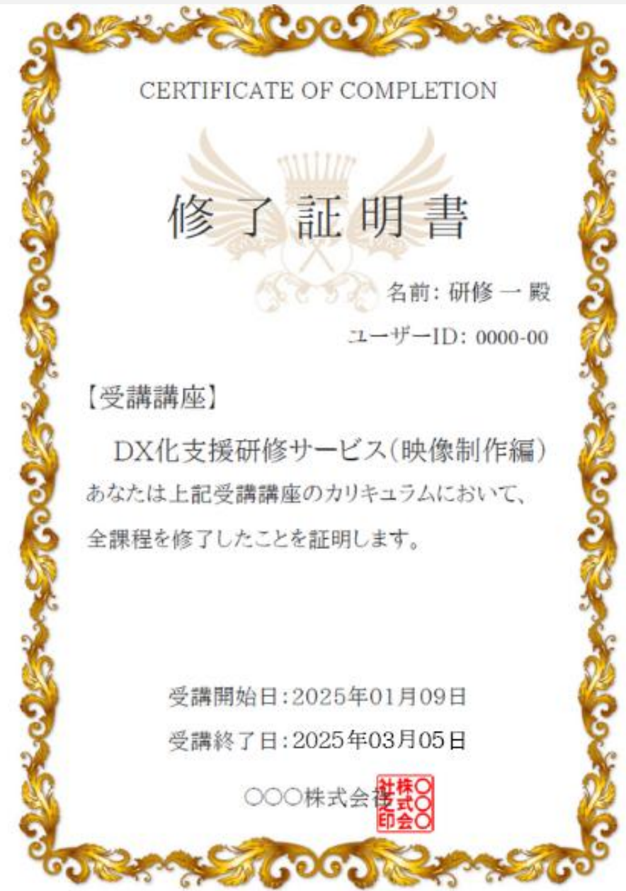
修了証明書イメージ