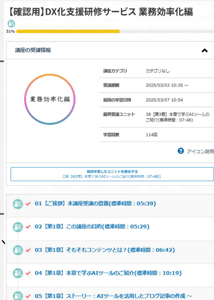
プラットフォームイメージ

受講者ごとの学習進捗はもちろん、 視聴日時の記録をCSVデータで 出力が可能です